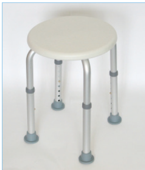
Stuhl komplett - Shower stool complete